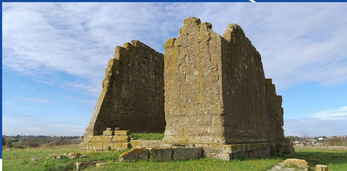
Tempio di Giunone – Antica città di Gabii (Roma)